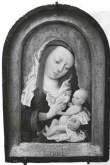
Maria met kind, Rogier van der Weyden (1520). Olieverf op paneel, 17.7 × 12 cm.