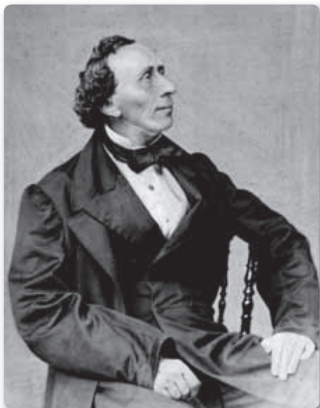
Hans Christiaan Andersen