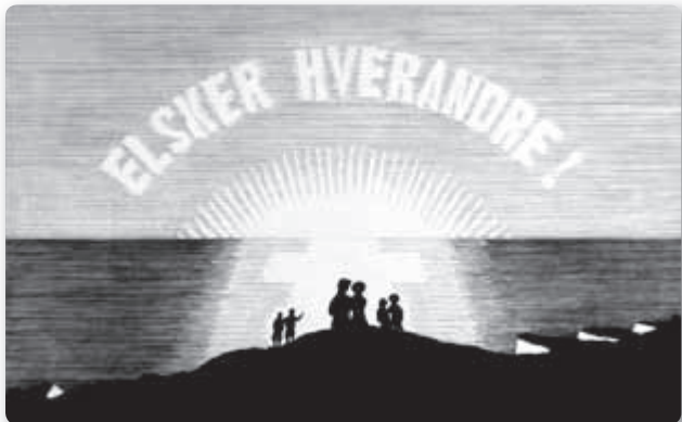
© MARTINUS IDEALFOND, 1934. REG. 44

Pas na deze fundamentele ervaring van de heilige geest of Gods eigen bewustzijn kan van het individu gezegd worden dat het 'de ware of volmaakte mens' is. Dat wil weer zeggen dat het na eerst een embryo geweest te zijn nu 'een pasgeboren kindje' geworden is in het werkelijke bestaan oftewel absoluut bewust is in de goddelijke beleving van het leven.