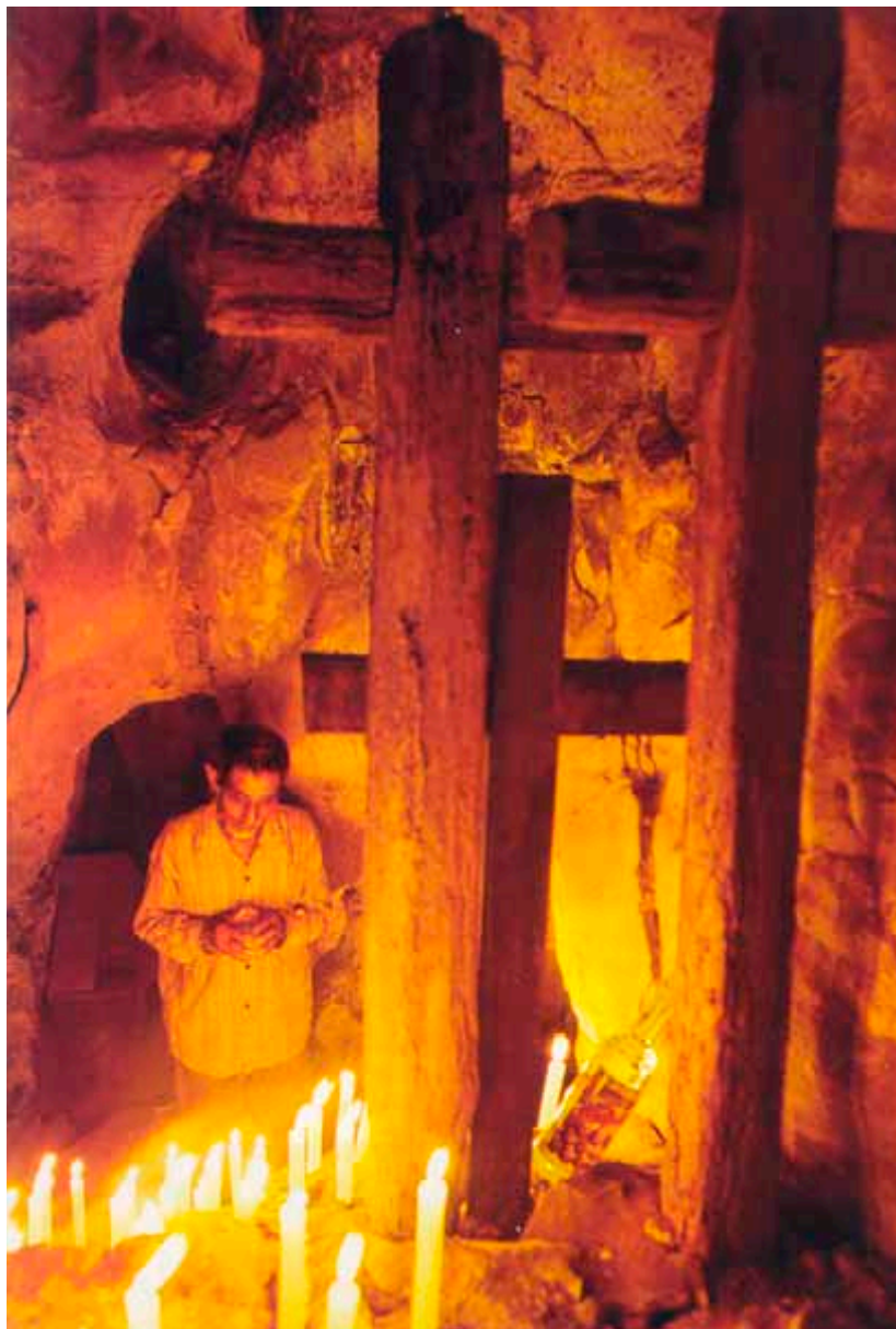
Biddende man, afkomst onbekend