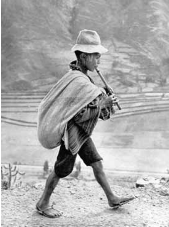
meisje uit Peru