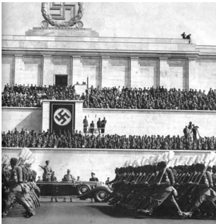
Nazi parade, 1937

worden in beter oorlogsmaterieel (moordwapens en alle overige cultuurvernietigingsmachines) waarmee de moderne maatschappij beschaving en vrede denkt te kunnen scheppen. Door hun wederzijdse angst zijn de twee fronten er vooral in geïnteresseerd elkaar te vernietigen. Mensen willen mensen doden. Een grotere kosmische duisternis bestaat er niet. De verloren godenzoon (Luc. 15:11-32) aanbidt de dood in plaats van het leven.