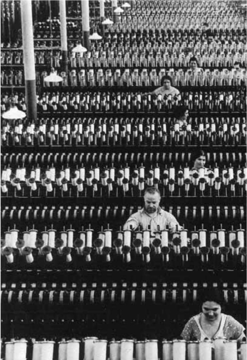
American Woolen Co., Neuenland, 1935