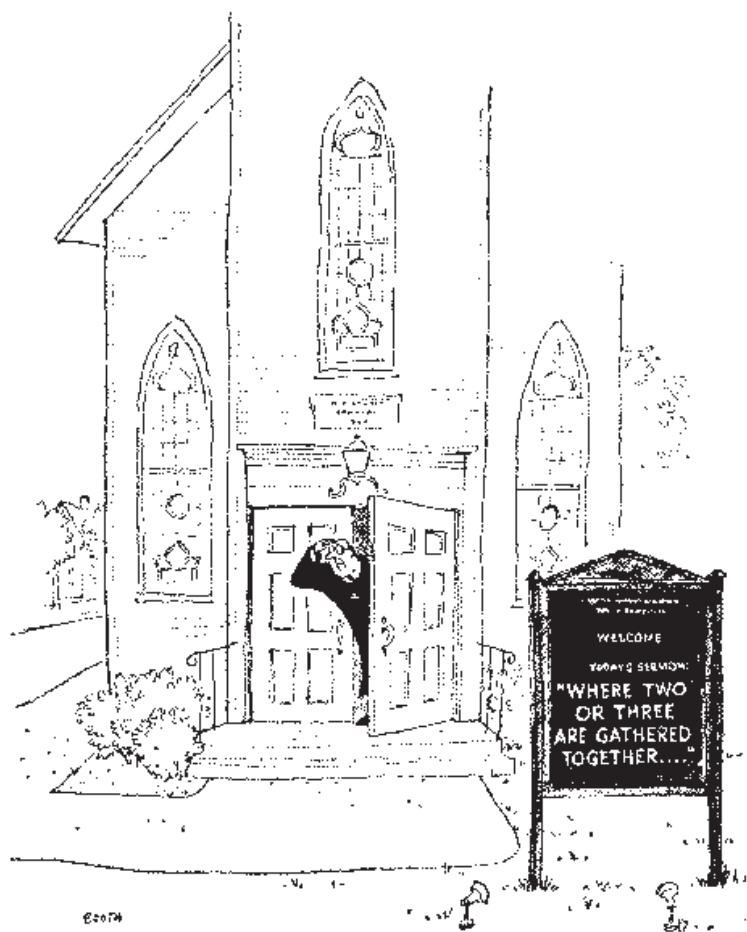
cartoon door Booth