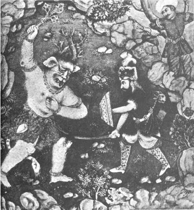
Indo-Persische kunst, Bibliothèque Nationale Paris