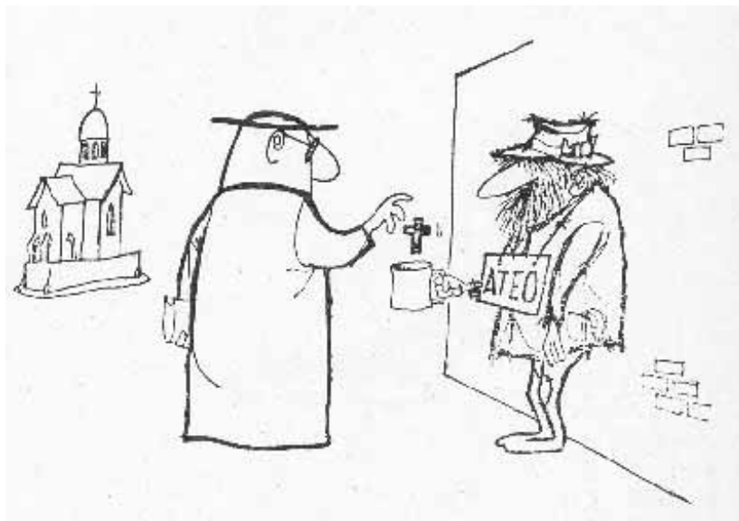
cartoon van: Mundo Quino