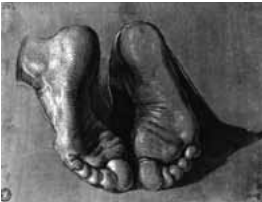
Voetzolen. Pen en witte hoogsels op groen geprepareerd papier, 17,7 x 21,7 mm. Albrecht Dürer (1471-1528)

kleiner deel van Gods beeld of van het gedrag en de kennis die Gods doel met alle levende wezens en nu als eerste met de aardse mens zijn. Oorspronkelijk is Christus de aanduiding voor de beginnende werkelijk menselijke structuur in de mens. Christus is de uitdrukking voor het deel van de mentaliteit van een wezen dat tot volmaaktheid ontwikkeld is en dat dus één met God is. Het is feitelijk hetzelfde als wat nu in de nieuwe wereldbeschaving kosmisch bewustzijn genoemd zal worden. Christus is dus een principe. Dit principe behelst het volmaakte algehele liefdesbewustzijn en de dagbewuste kennis van de oplossing van het levensmysterie. De eerste prille incarnatie van dit principe in het dier zorgde ervoor dat het een mens werd. Alle mensen hebben dus vandaag de dag iets van deze mentaliteit in zich. De mens is gedeeltelijk een dier in de mate waarin hij nog een dierlijke mentaliteit in zijn psyche heeft en gedeeltelijk een Christus in de mate waarin hij een Christusmentaliteit in zijn psyche heeft. De wezens die wereldverlossers of stichters van godsdiensten werden, waren zodoende wezens die veel meer Christusmentaliteit in zich hadden dan de grote massa waarnaar ze gezonden waren. Het waren allemaal Christuswezens in de mate waarin ze de Christusmentaliteit in hun mentale structuur ontwikkeld hadden.