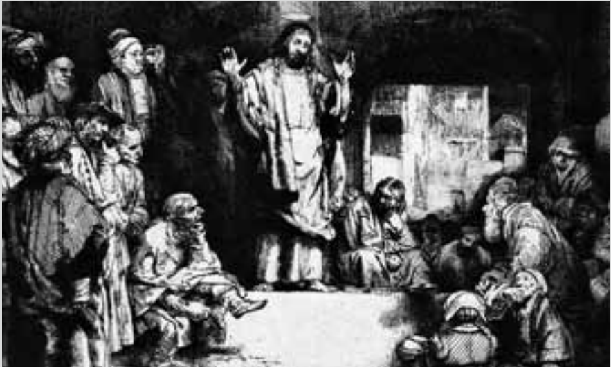
Tekening van Rembrandt van Rijn (1606-1669)

hoogste waarheid van het leven in intellectuele vorm of bewoording konden ontvangen. Daarom moest Christus erin volstaan om over de hoogste waarheden van het leven te vertellen met adviserende dogmatische uitdrukkingen, symbolen of gelijkenissen, die de mensen met hun instinct konden vatten en er daardoor in konden geloven. Maar Gods schepping van de mens naar zijn beeld was niet iets waarin de mensen alleen zouden moeten blijven geloven. Het moest wakkere dagbewuste kennis of feitelijkheid voor ieder mens worden. Dat was het goddelijke sprookje, dat was het ‘vele’ dat Christus te vertellen had, maar dat de mensen destijds niet intellectueel verteld kon worden. Daarom zal het hier als de Trooster of Voorspreker, de Heilige Geest, als Het Derde Testament van het Bestaan, gemanifesteerd of geopenbaard worden.