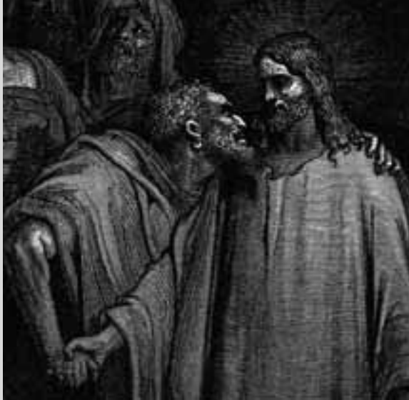
Het verarad van Judas, Gustave Doré (1832-1883)

nu? En zijn ze juist daarom niet allemaal zonder uitzondering aan het uitsterven? Zijn de Bergrede van Christus en de andere woorden die rechtstreeks door de Wereldverlosser zijn uitgesproken niet de ware weg naar verlossing, en geen dreiging met de hel? Niet oorlog, strijd of straf zijn het ware christendom. Deze regelingen zijn voorgebracht door judassen binnen het christendom. Dat zijn wezens voor wie de bekering en de verbetering van de mensen niet snel genoeg kon gaan. En dat leidt ertoe dat ze een kruisiging ensceneren. De gevolgen zijn dezelfde als de gevolgen die Judas voor de Wereldverlosser in gang gezet heeft. Kunnen we niet terugzien op heksenverbranding en in de ban doen als een 'kruisiging' die door de judasmentaliteit veroorzaakt is? Een mentaliteit die zo'n haast heeft dat zij helemaal geen tijd heeft voor vergeving of om de rechterwang toe te keren als zij op de linker geslagen wordt.