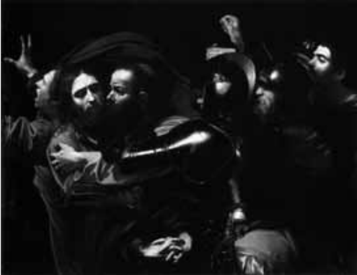
The Taking of Christ, 1602; Caravaggio (1571-1610); National Gallery of Ireland, Dublin

sche stralen of liefdesenergieën is dan veel te krachtig en kan soms, in het ergste geval, tot krankzinnigheid leiden, als zij voor de betrokken persoon al geen zelfmoord betekent. Wat Judas betreft gebeurde er dit: in de goddelijke stralen van de Heilige Geest zag hij zijn eigen geestelijke naaktheid en zag hij zijn onvolmaaktheid en lagere aard in zo'n scherp contrast tot zijn vroegere Meester, aan wiens martelaarschap hij zelf had meegewerkt, dat hij een afkeer van zichzelf kreeg en zichzelf zelfs begon te haten. Omdat hij niet in staat was om dit verschrikkelijke zelfbeeld kwijt te raken en evenmin de gevolgen van zijn verraad kon verhinderen, noch het lijden van Jezus kon verzachten – ja, hij had hem zelfs door zijn verraderlijke kus met een pantser van bewapend krijgsvolk, grofheid en brutoheid omringd – werd hij met wanhoop vervuld. Hij, die eerst elke dag in overvloed van de liefde en wijsheid van zijn Meester had kunnen genieten, had door zijn misstap