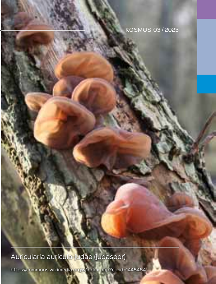
Auricularia auricula-judae (judasoor)

De naam judasoor komt van de legende over de Bijbelse figuur Judas Iskariot. Deze paddenstoel was te zien op de vlier waaraan Judas zich had opgehangen nadat hij Jezus verraden had. De paddenstoel heeft de vorm van een oor en er werd gedacht dat de paddenstoel het oor van Judas was.