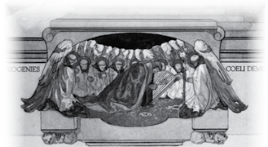
Detail van Canto xxii uit De Goddelijke Komedie van Dante Alighieri, illustratie door Franz von Bayros (1866-1924), Wenen

en haar relatie tot de hoogste en eeuwige sferen in de spiraalkringloop. Zoals we zien vertegenwoordigt de aarde op dit symbool vooral het domein van het dierenrijk oftewel het vagevuur. Wanneer zij overgegaan is naar het werkelijke domein van het [ware] mensenrijk, waar zij nu naar op weg is vanwege de geopenbaarde, beginnende antipathie van haar mensheid tegen oorlog en het verlangen van deze mensheid naar werkelijke vrede, zal dit goddelijke rijk de culminerende plaats in de kosmische structuur van de aarde innemen die de duistere zone van het vagevuur nu inneemt en die is weergegeven als het donkere culminerende gebied in het midden van de stralenglorie op het symbool. Zo zullen alle rijken van de spiraal bij toerbeurt het culminerende gebied in de psychische of geestelijke structuur van de aarde innemen. Op die manier zullen ze ook na elkaar hun culminerende plaats in de geestelijke structuur van ieder ander levend wezen innemen en daar in de vorm van tijd en ruimte het contrast of de achtergrond tot stand brengen waartegen het identiek-zijn van het levende wezen met de eeuwigheid en de Godheid zich openbaart.