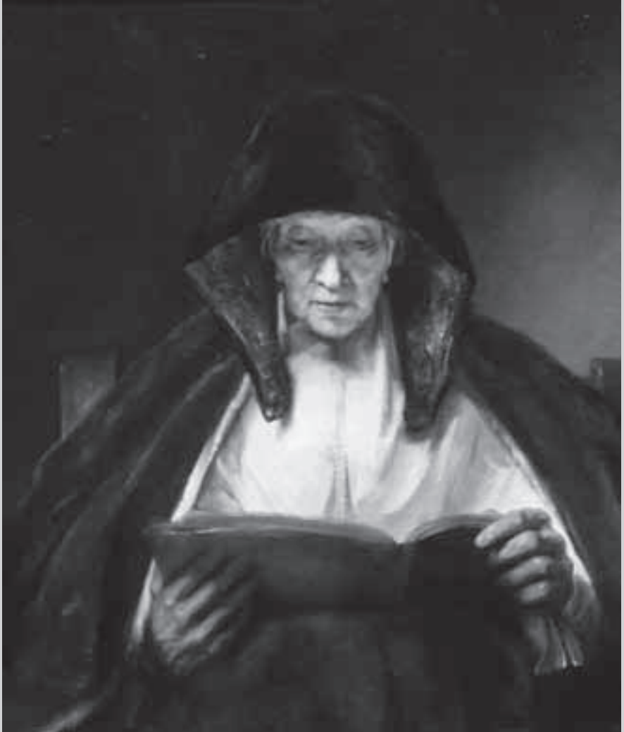
Lezende oude vrouw (1655), Rembrandt van Rijn (1606-1669)