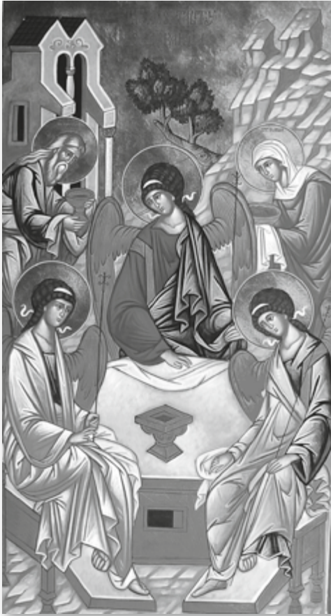
Icoon van "De Gast- vrijheid van Abraham" bij de ingang van de Holy Trinity Church, Port- land, Maine (USA).

natuurlijk vanzelf dat de mens niet op een dusdanige manier moet denken dat dit organisme verwoest wordt. Als zijn organisme in de loop van miljoenenjarige tijdperken, via een oneindige hoeveelheid verschillende processen, tot zo'n volmaaktheid ontwikkeld is als het is, dan kan het niet de bedoeling van het leven zijn dat de mensen, daar waar het organisme aan de eigen sturing van de mensen overgelaten is, overal kortsluitingen beginnen te maken en dit organisme door eigen ingrepen zullen verwoesten. Dat is niet de bedoeling. De mens mag vanzelfsprekend het een en ander