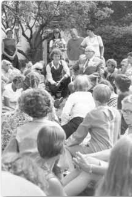
'Garden party' met Martinus bij villa Rosenberg in juli 1973.

zeer bevoorrecht te voelen, omdat ik als kind en als volwassene de gelegenheid kreeg zo dicht bij Martinus te zijn.