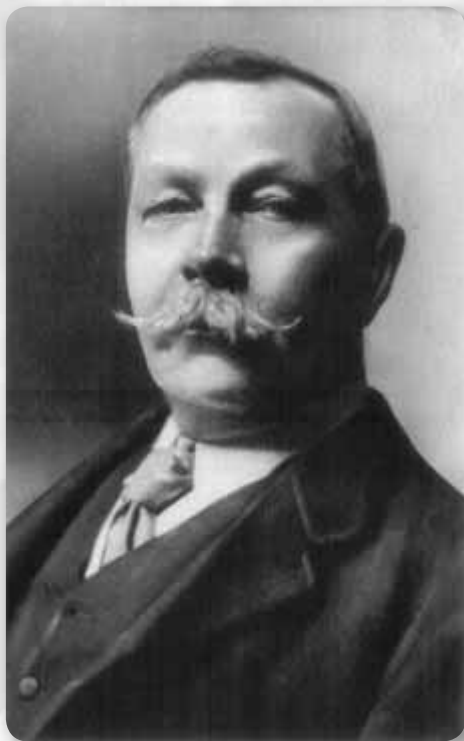
Sir Arthur Conan Doyle

D e legendarische meesterspeurder Sherlock Holmes kon niet alleen misdaden en raadselachtige moorden oplossen. Hij begreep ook het raadsel achter de natuur, kende de oplossing van het levensmysterie. Natuurlijk niet gedetailleerd, maar hij zag duidelijk een weg naar de oplossing van