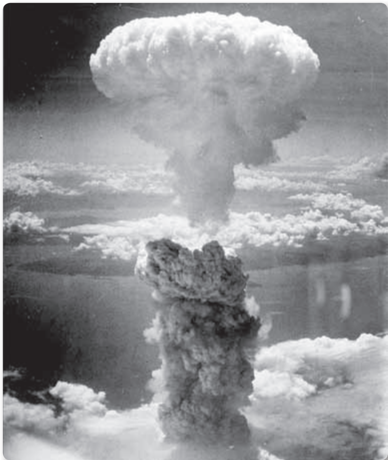
Atoombom op Nagasaki op 9 augustus 1945, Charles Levy.

en meer vredelievend en begerenswaardig zijn dan de onze. Hoe moeten de mensen vrede stichten? Het zijn immers niet de mensen die schuldig zijn aan de oorlog en strijd, maar de inbeeldingen, de illusies of de valse voorstellingen oftewel het moderne bijgeloof. Dus niet het vlees en bloed van de mensen maar hun psyche is de ware oorzaak van de oorlog. Oorlog tegen lichamen of tegen vlees en bloed voeren is daarom dwaas, aangezien deze factoren de vijand niet zijn. Wat voor nut heeft het als er zo en zoveel licha-